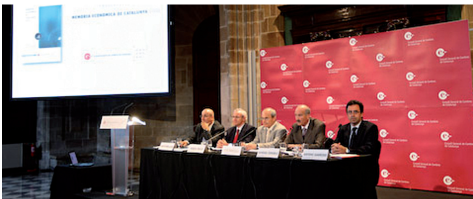
Otra imagen del acto de presentación de la memoria

“La superación de la crisis actual y el diseño de un nuevo modelo económico de futuro para el Principado exigen establecer prioridades y estrategias que permitan reforzar los puntos fuertes de nuestro tejido productivo”